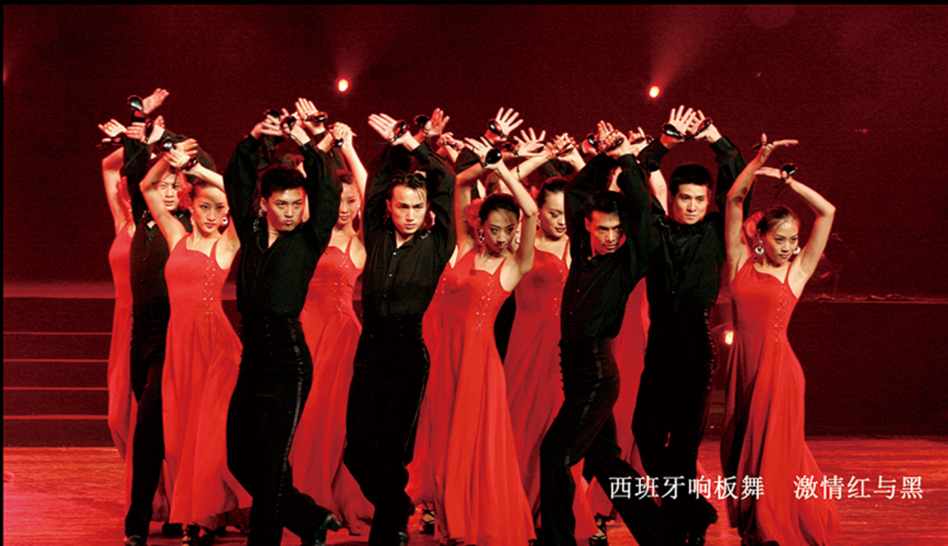
西班牙响板舞 激情红与黑