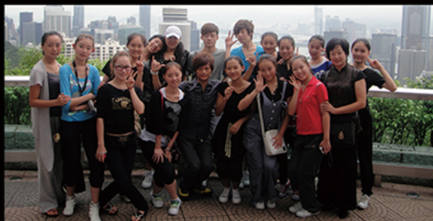
我校学生赴港演出之余浏览香港城市风貌