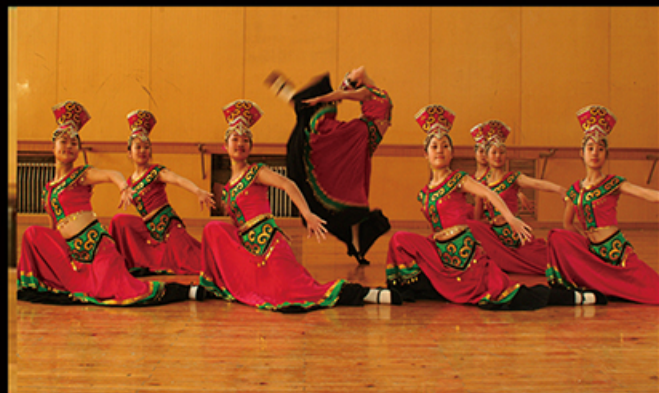
《花枝舞》荣获北京市第八届舞蹈比赛一等奖