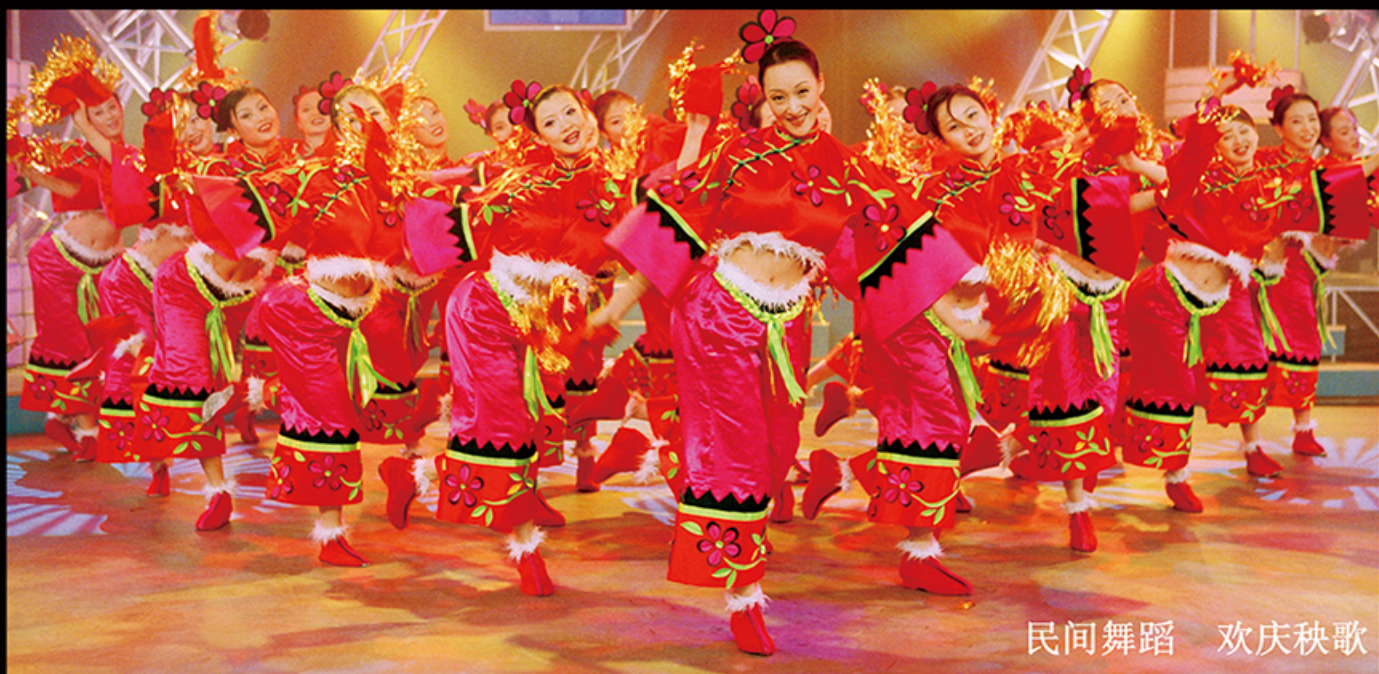
民间舞蹈 欢庆秧歌