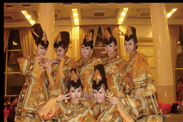
我校学生参加大型舞蹈史诗《复兴之路》