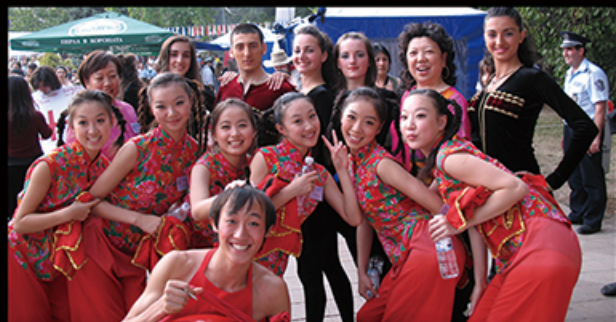
我校学生出访保加利亚